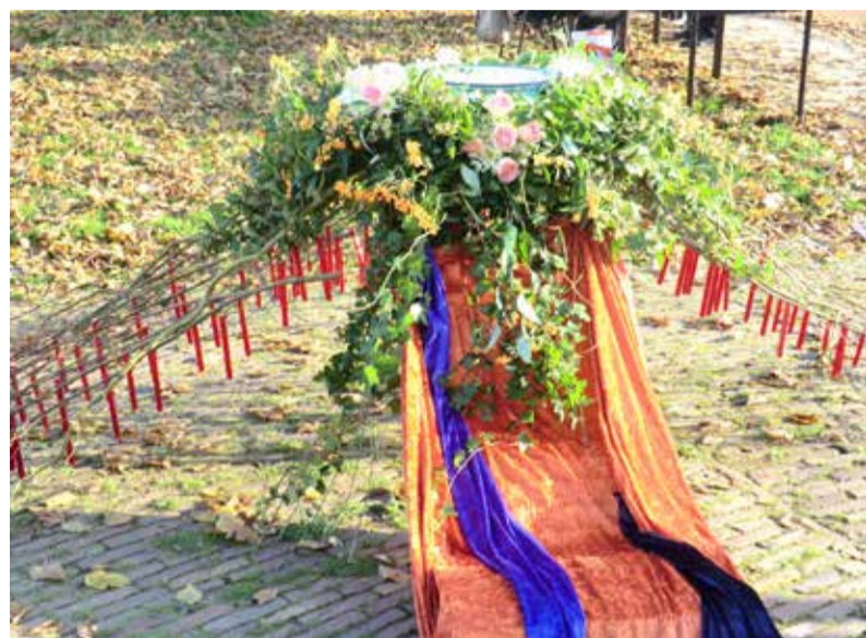
'Levensweg en bron', kunstwerk herdenkingsbijeenkomst bij de Watertoren, herfst 2015